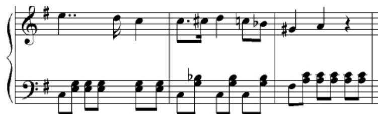
Ejemplo 8: Salve Regina a duo, parte de piano, cc. 23–25.