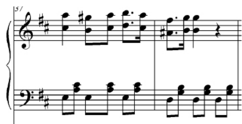
Ejemplo 6: Salve Regina a 3 voces, parte de piano cc. 37–38.

También en las tres obras se pueden observar rasgos del acompañamiento usado en las canciones de salón, con una rítmica marcada y estable que transita por diversos acordes en función de la melodía.