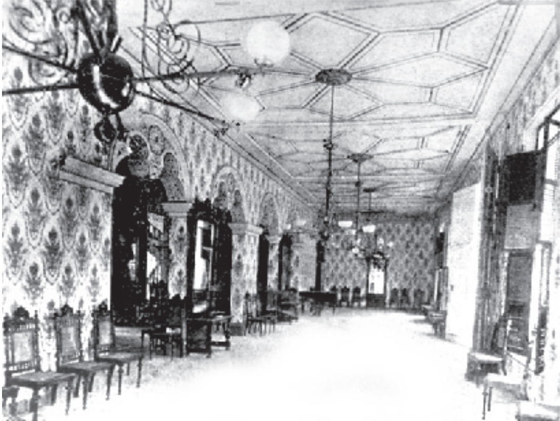
Sociedad Filarmónica de Santiago de Cuba, siglo xx