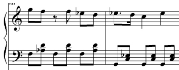
Ejemplo 7: Salve a Nuestra Señora de los Desamparados , parte de piano, cc. 86–87.