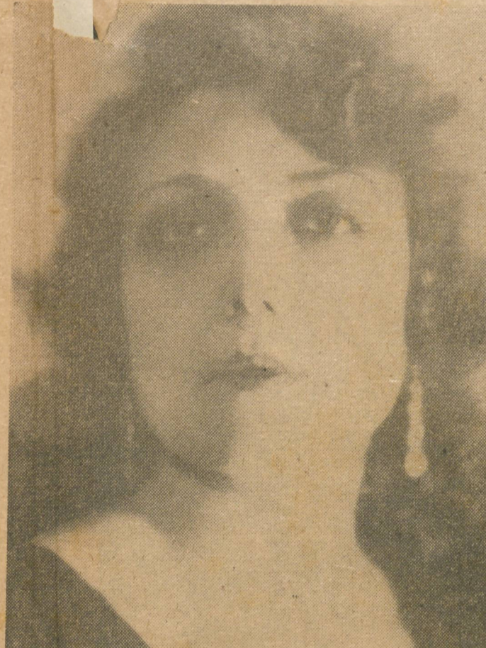
CONCHITA SUPERVIA, gran cantante.