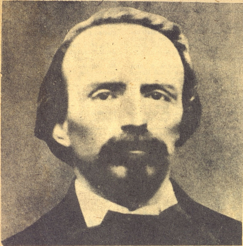
Carlos Manuel DE CÉSPEDES, Padre de la Patria y Primer Presidente de la República, a quien el pueblo de Cuba rendirá homenaje público, con motivo del Cincuentenario de la Independencia, erigiéndole un monumento en el parque de la Plaza de Armas, que lleva su nombre glorioso, en nuestra capital.