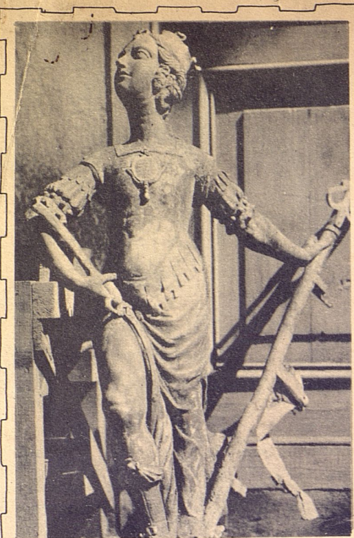
Bellísima estatua en bronce, que la tradición considera como representativa de La Habana, tal como se encuentra hoy, después de ser arrancada por el ciclón último, del torreón de la Fuerza.

El ciclón que el 20 de octubre último azotó furiosamente nuestra capital, causando en ella, además de algunas pérdidas de vidas, enormes destrozos en parques, plazas, calles y edificios, descubrió a los habaneros de hoy algo interesantísimo, que solo conocían algunos viejos habaneros, como el cronista autor de estas líneas: que en la ciudad de la Habana, al igual que en otras muchas ciudades de Europa y América, tenía su estatua simbólica, de un alto valor histórico y hasta artístico.