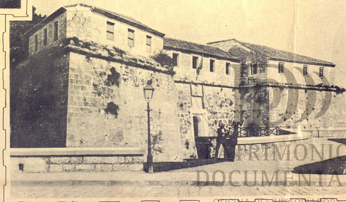
Vista general y entrada del Castillo de la Fuerza, tal como se encuentra hoy día.