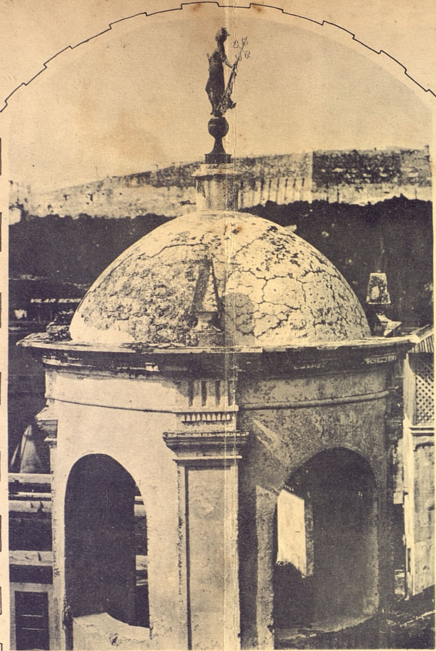
El torreón y campanario del Castillo de la Fuerza, coronado por la estatua en bronce de La Habana, que el ciclón arrancó y echó a tierra. Al fondo se ve la fortaleza de la Cabaña.

Y fué necesario, para que ésta se acometiese, el que en 1538, y siendo su Gobernador