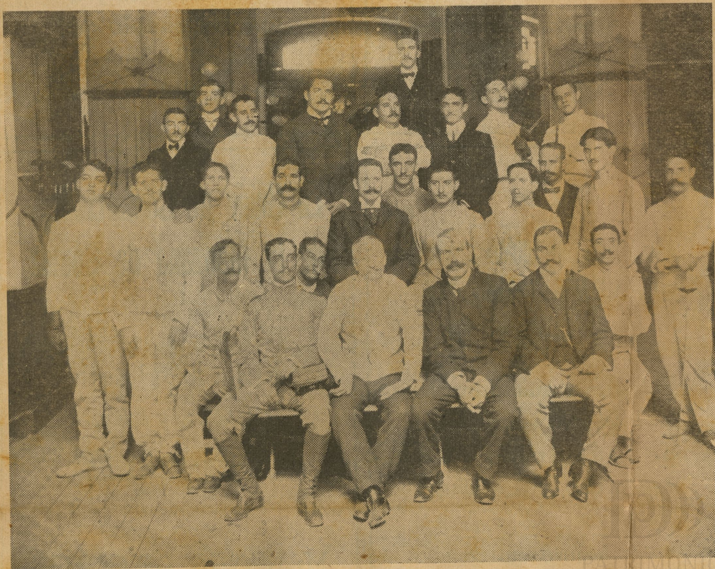
LA INAUGURACION DE LA SALA DE ARMAS DEL CASINO ESPAÑOL