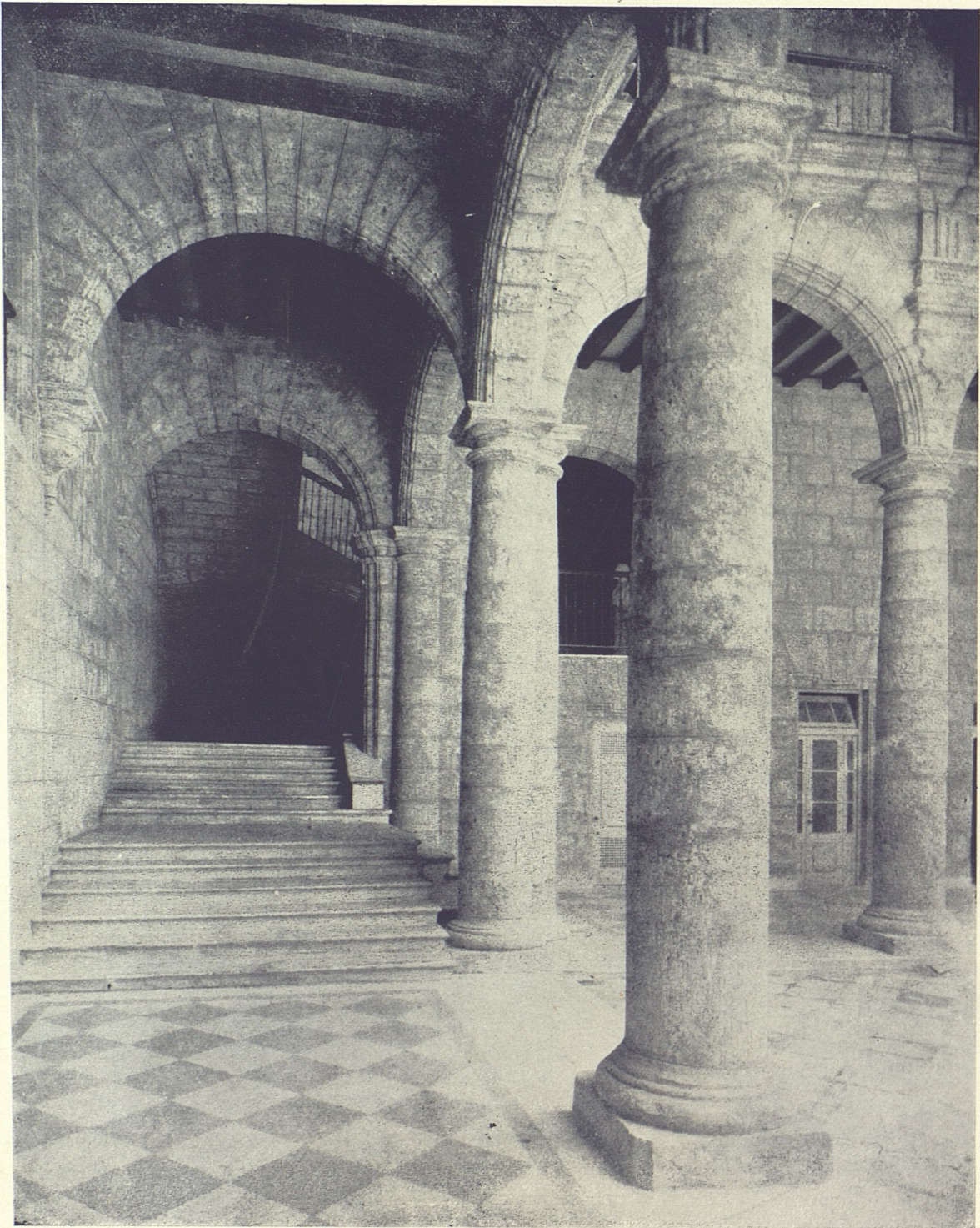
Palacio del Ayuntamiento. Escalera principal.—Restauradores: Govantes y Cabarrocas, arquitectos. Contratistas: J. A. Mendigutia. Piso de granito: Luis Mión.

temporáneos con el nombre del “Fisonomista”. Esta colección, Don Luis de Pardo Pimentel la estimaba de poco valor por su pobre ejecución y técnica.