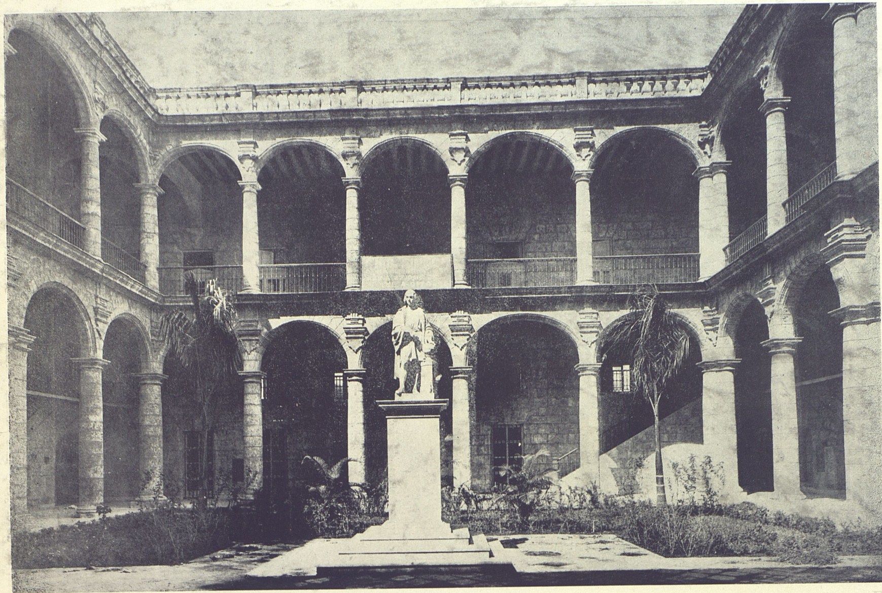
Palacio del Ayuntamiento. Nueva galería en la planta baja.—Govantes y Cabarrocas, arquitectos. Raúl Simeón, contratista.