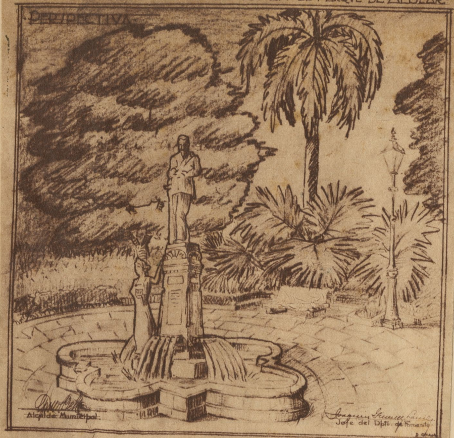
HE AQUI LA PERSPECTIVA de la estatua de Albear, tal como habrá de quedar después de las obras de embellecimiento que va a realizar el Municipio de la Habana