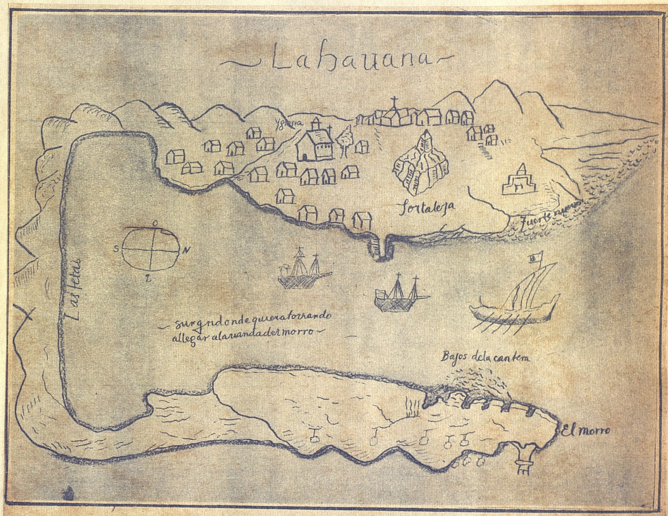
Un viejo croquis, el más antiguo que se conoce, de la bahía de La Habana, trazado en el siglo XVI por un pirata que llamaban "Carga-patache" para su uso.