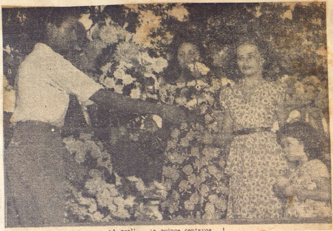
—¡A real!... ¡a quince centavos...!