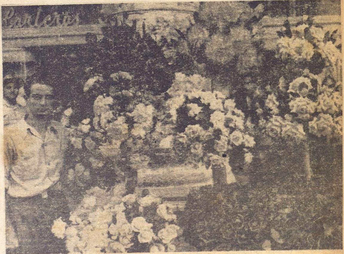
Rosas, margaritas, claveles, orquideas, pensamientos