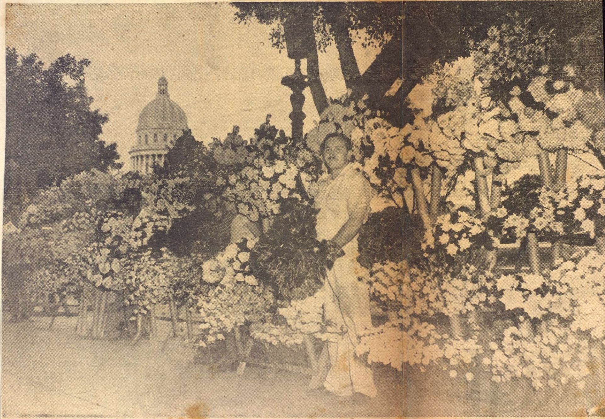
Cada mañana, los vendedores se van colocando con sus tableros, por orden de llegada.