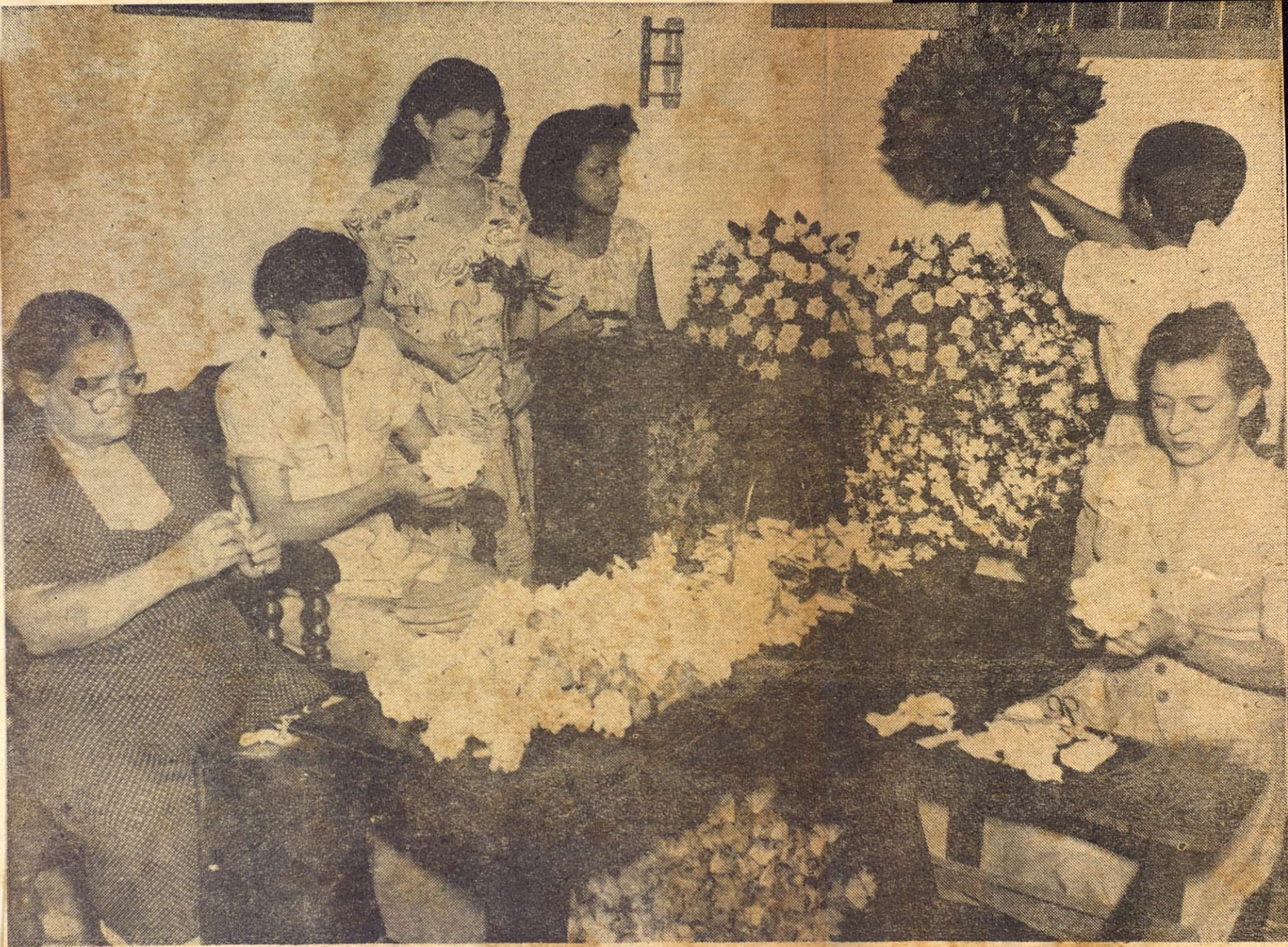
Una de las primeras familias que se dedicaron a fabricar flores artificiales...