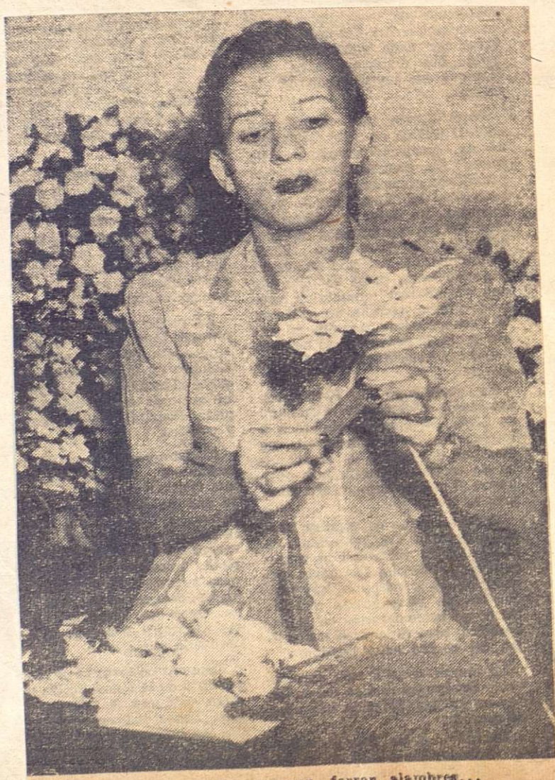
...cortan pétalos, enceran, forran alambres...