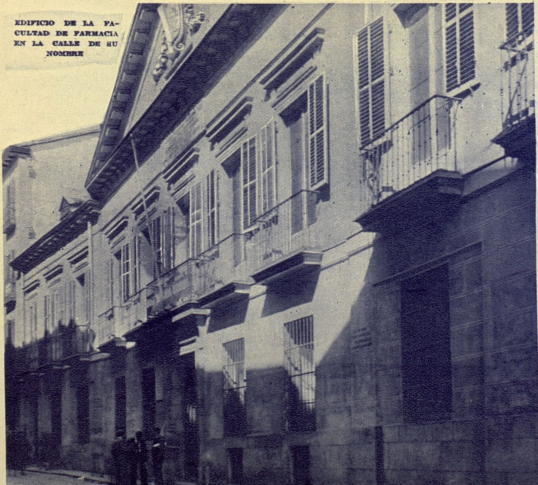
EDIFICIO DE LA FACULTAD DE FARMACIA EN LA CALLE DE SU NOMBRE

El año 1823 es la fecha de otro museo en que Minerva deja plaza a Marte. El 9 de enero creó el de Artillería, separándole del de Ingenieros, con el que hubo construido el Museo Militar en 1814, y dejando el de