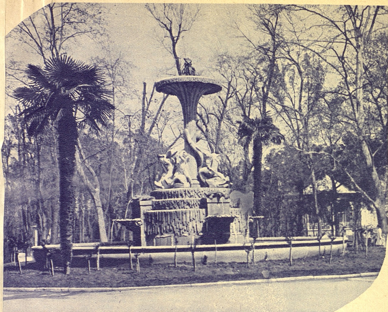
LA FUENTE LLAMADA DE LOS GALAPAGOS, ACTUALMENTE EN EL PARQUE DEL RETIRO.

castrificación en el palacio de Buenavista, llevó su otra rama a la parte del alcázar del Buen Retiro, donde estuvo el Salón de Reinos, y en el que permanece con tan adecuados centinelas como Felipe IV y Luis I, fundador aquél y nacido éste en el propio real sitio, que así guardan en efígie la entrada de la histórica residencia.