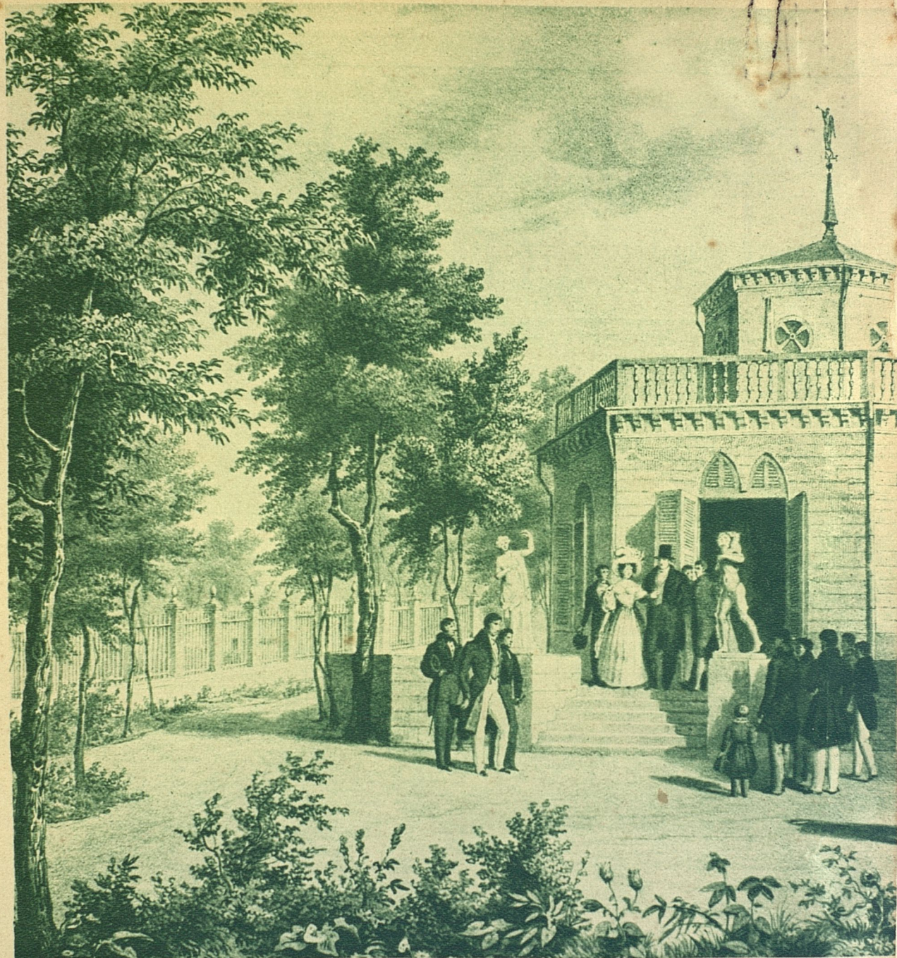
VISITA DE FERNANDO VII Y SU ESPOSA A LA POSESION LLAMADA EL TIVOLI, DONDE ESTABA EL REAL ESTABLECIMIENTO TIPOGRAFICO. (CURIOSO GRABADO ANTIGUO PERTENECIENTE A LA COLECCION DEL AUTOR DE ESTE ARTICULO)

Fernando VII. Una, obra comenzada por el gran escultor español José Alvarez Cubero y terminada por Antonio Solá, el autor de la imagen de Cervantes que vemos en la plaza de las Cortes, preside la histórica plaza de Armas de La Habana, y ha sido respetada por los Gobiernos de la independencia de ese país no sólo por su valor artístico, sino porque los cubanos no pueden olvidar que en 1818 fué Fernando VII quien les concedió la libertad de comercio. Y otra estatua