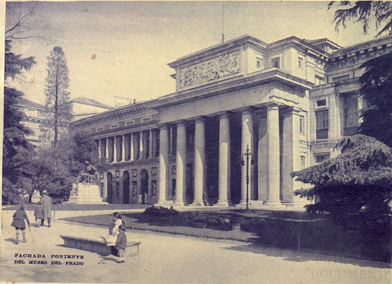
FACHADA PONIENTE DEL MUSEO DEL PRADO

Es más, Fernando VII tiene monumentos que perpetúan su memoria. En Madrid llegó a existir el basamento para uno de ellos en el Retiro, donde estuvo la fábrica de porcelana de China, volada por los ingleses el año 1812 en la isleta de San Antonio, lugar donde hoy se alza el grupo escultórico del Angel Caído. En Sevilla, dentro de los jardines del palacio de San Telmo, se mira el bronce de la efigie de aquel rey. Aun algo más grato para todo español existe aún. En la última colonia perdida, en la isla de Cuba, permanecen dos estatuas de