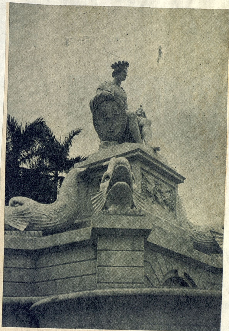
"¡Bella Fuente de la India, la más hermosa entre mil!".