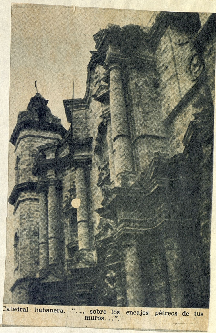
Catedral habanera. "... sobre los encajes pétreos de tus muros...".