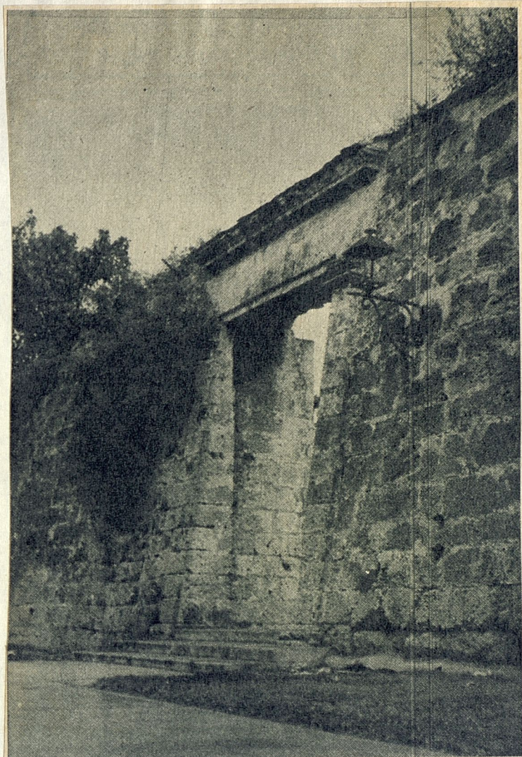
"Puerta de la Tenaza, con tus farolas".