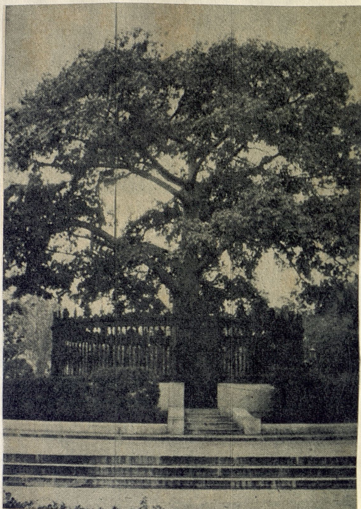
El Arbol de la Fraternidad. "Porque tú simbolizas nuestro amor por la América".